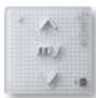
Smoove Origin IN io Pure