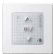
Smoove Origin io Pure inkl. Somfy Smoove Rahmen Pure