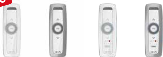
Situo 1 Variation io Pure II Situo 1 Variation io Iron II Situo 5 Variation A/M io Pure II Situo 5 Variation A/M io Iron II

io-Funkhandsender für die Ansteuerung einzelner oder von bis zu 5 Gruppen von io-Empfängern bzw. Antrieben. Verwendbarkeit mit io-Antrieben und io-Empfängern siehe Seite 26.